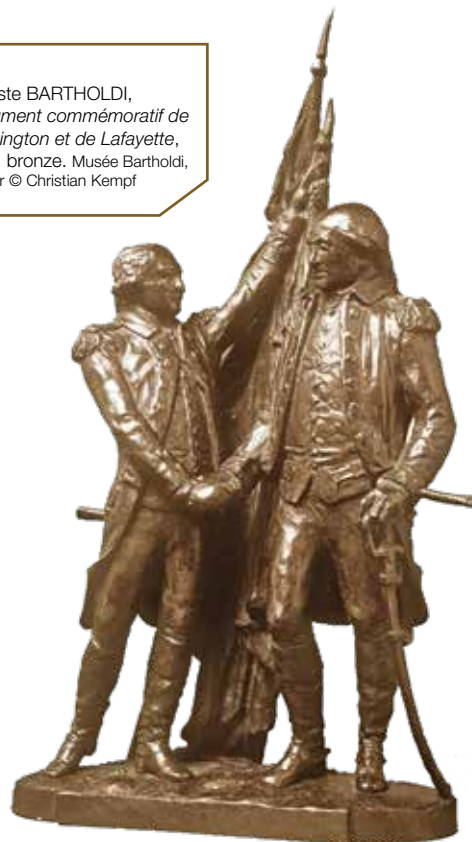
Auguste BARTHOLDI, Monument commémoratif de Washington et de Lafayette, 1892, bronze. Musée Bartholdi, Colmar

La Déclaration des Droits de l'Homme et la question de l'esclavage restent sans doute les débats les plus emblématiques de cette période.