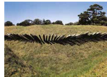
Yan MORVAN, Champs de bataille. Bataille de Yorktown, 28 sep- tembre – 19 octobre 1781. Yorktown, Virgi- nie, Etats-Unis, 2017, cibachrome. Musée de l'Armée, Paris © Yan Morvan

Frères d'armes et frères d'esprit, les Etats-Unis et la France unissent leurs destins pour toujours.