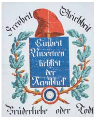
DOLLFUS-MIEG et C o , Feuille emblème de la République, 1792, papier vergé, impression à la planche en 9 couleurs. Musée Unterlinden, Colmar

Par son action en faveur des jeunes Etats-Unis et ses convictions prorévolutionnaires, Lafayette se fait acteur de la liberté. Retour sur l'allégorie d'un concept.