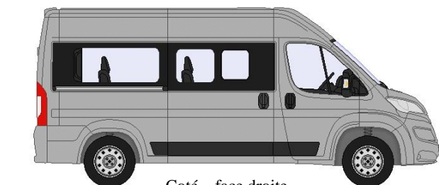
Coté – face droite