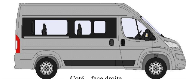
Coté – face droite