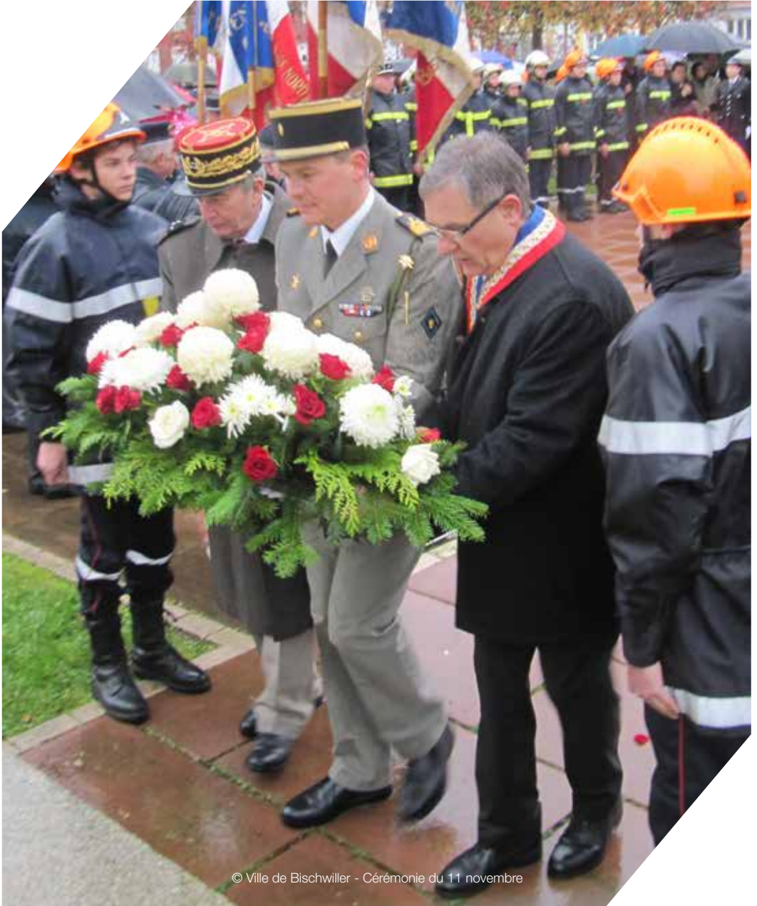
Cérémonie du 11 novembre