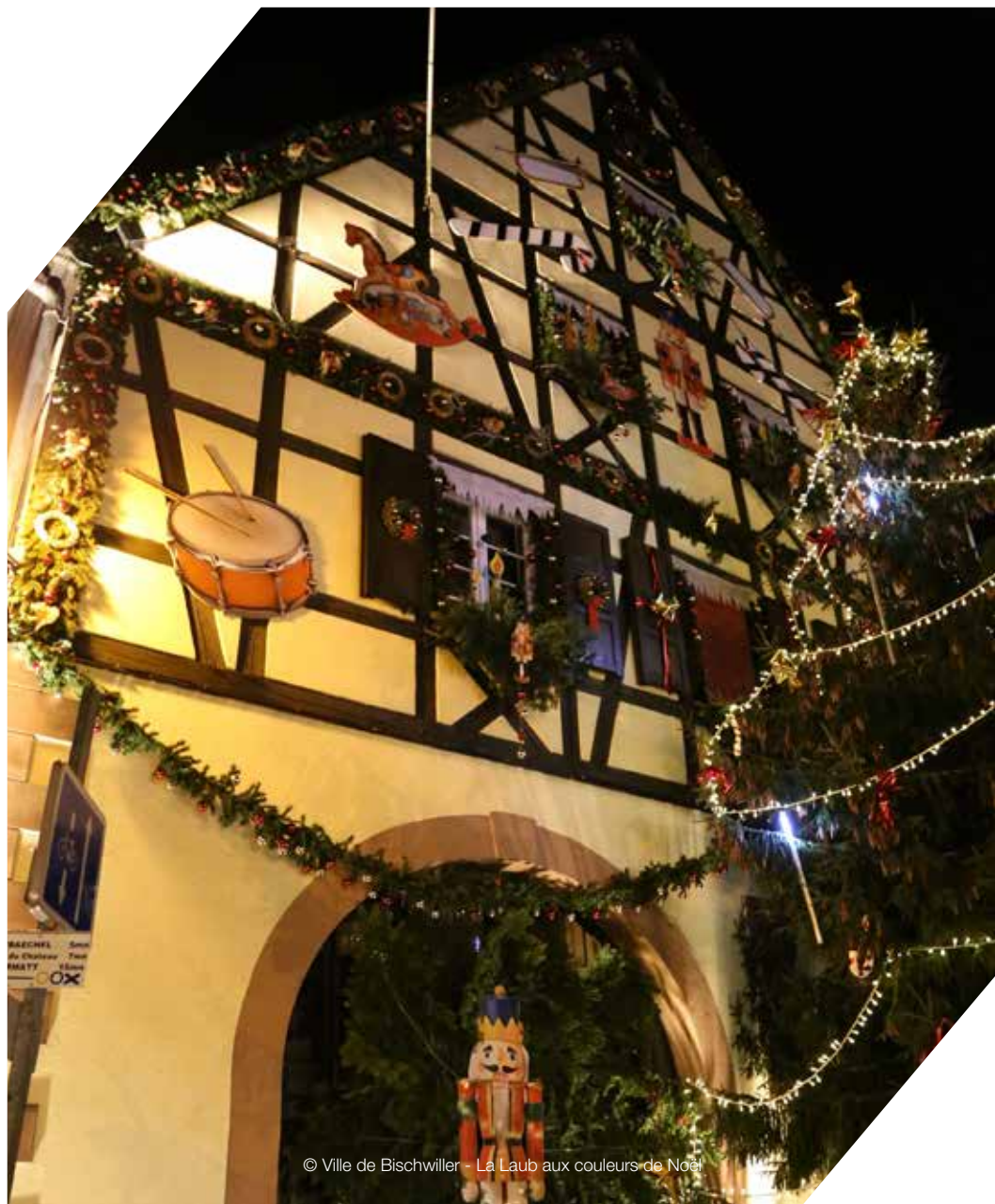
La Laub aux couleurs de Noël