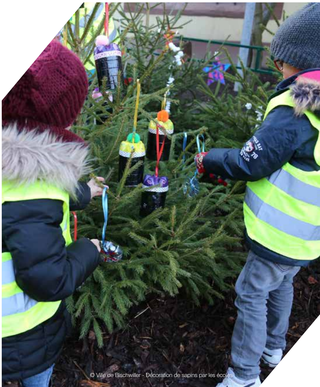
© Ville de Bischwiller - Décoration de sapins par les écoles